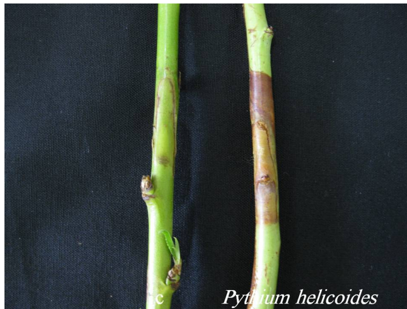
شکل ۳. علائم بیماری حاصل از مایه‌زنی Ovatisporangium helicoides روی شاخه بریده بادام در مقایسه با شاهد (سمت چپ) Fig. 3. Symptoms of Ovatisporangium helicoides inoculation on detached shoots of almond in comparison with control (left)