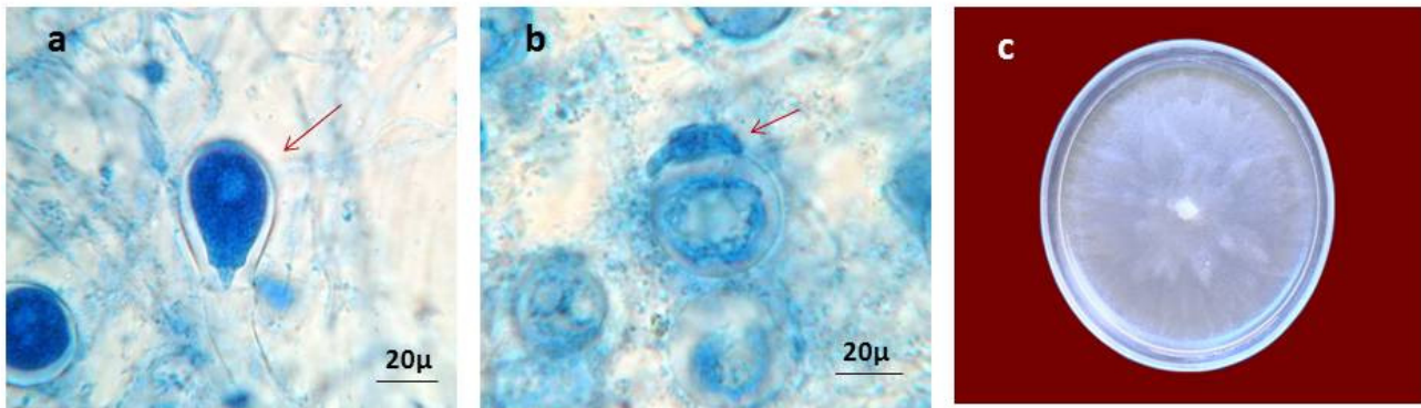
شکل ۱. a: اسپورانژیوم، b: تماس اگونیوم و آنتریدیوم و آنتریدی c: کلنی قارچ در Ovatisporangium helicoides روی محیط کشت CMA Fig. 1. a: sporangium, b: connection between Oogonium and Anthridium, c: colony of Ovatisporangium helicoides on CMA