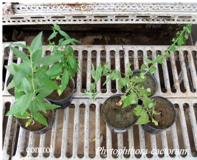
شکل ۴. علائم بیماری توسط قارچ Phytophthora cactorum روی دانه‌های بادام در مقایسه با شاهد (سمت چپ) بعد از گذشت هفت روز از مایه‌زنی