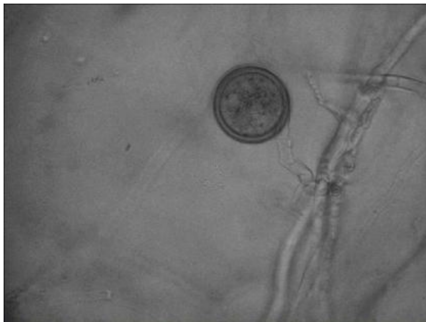
Fig. 1. Clamydospore formation of Phytophthora parsiana on carrot agar medium after 15 days at 4°C