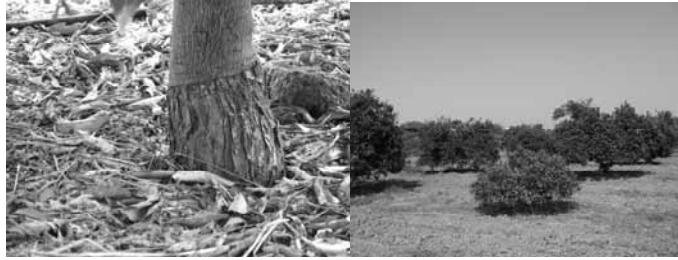
شکل ۱. علائم کوتولگی (راست) و پوسته پوسته شدن (چپ) پرتقال تامسون روی پایه سیترنج (نمونه LMP3).