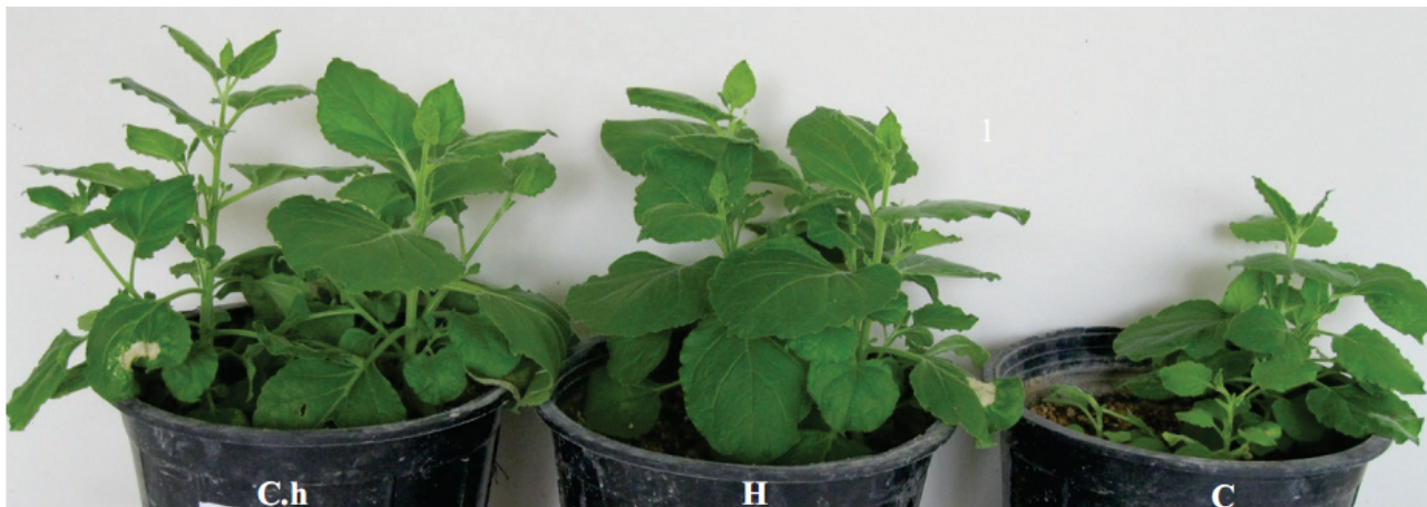
شکل ۲) اثر ویروس موزائیک خیارو سازه pFGC-2b-h بر روی وضعیت رشدی و علائم در گیاهان N. benthamiana سه هفته بعد از مایه زنی. (H) گیاه سالم آلوده نشده به ویروس اما بیمار شده توسط سازه خالی pFGC-K بصورت موقت (C) گیاه آلوده شده به ویروس و حامل بدون سازه (C.h) گیاه مایه کوبی شده توسط ویروس و حامل دارای سازه سنجاق سری pFGC-2b-h

Figure 2) Reaction of N. benthamiana plants to Cucumber mosaic virus three weeks after inoculation (H) Healthy plants that not inoculated with CMV but with pFGC-K construct, (C) Plants inoculated with CMV and pFGC-K, (C.h) plants inoculated transiently by pFGC-2b-h construct and CMV.