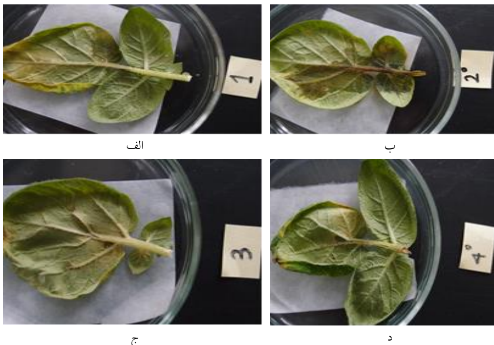
شکل ۲. برگ‌های سیب زمینی تیمار شده با گلیفوسیت و آلوده شده با باکتری‌های Dickeya dadantii ENA49 و Pectobacterium atrosepticum 21A. الف. برگ سیب‌زمینی تیمار شده با باکتری Pectobacterium atrosepticum 21A; ب. برگ تیمار نشده با گلیفوسیت و آلوده شده با Pectobacterium atrosepticum 21A; ج. برگ تیمار شده با گلیفوسیت و آلوده شده با باکتری Dickeya dadantii ENA49; د. برگ‌های تیمار نشده و آلوده شده با Dickeya dadantii ENA49

Fig 2. The treated leaves of potato by glyphosate and infected with bacteria, Pectobacterium atrosepticum 21A and Dickeya dadantii ENA49. a. The treated leaf of potato by glyphosate and infected with Pectobacterium atrosepticum , 21A; b. The untreated leaf by glyphosate and infected with Pectobacterium atrosepticum 21A; c. The treated leaf by glyphosate and infected with Dickeya dadantii ENA49; d. The untreated leaf by glyphosate and infected with Dickeya dadantii ENA49.