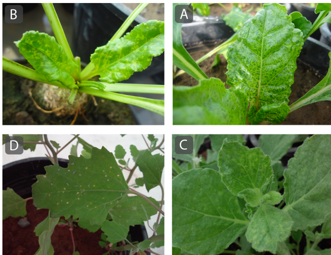
شکل ۱. علائم جدایه ایرانی ویروس موزاییک چغندر روی برگ‌های بالغ (A) و جوان (B) B. vulgaris به صورت موزاییک و تاوولی شدن، (C) N. benthamiana به صورت موزاییک و (D) C. quinoa به صورت لکه‌های نکروزه.