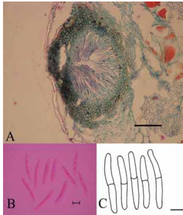
شکل ۱. Septoria sp. aff. alhagiae , برش پیکنیدیوم (A)، خط مقیاس ۵۰ میکرومتر، کنیدیومها (B&C)، خط مقیاس ۱۰ میکرومتر Fig 1. Septoria sp. aff. alhagiae , cross section of Pycnidium (A). Scale 50 \mu m, Conidia (B&C). Scale 10 \mu m