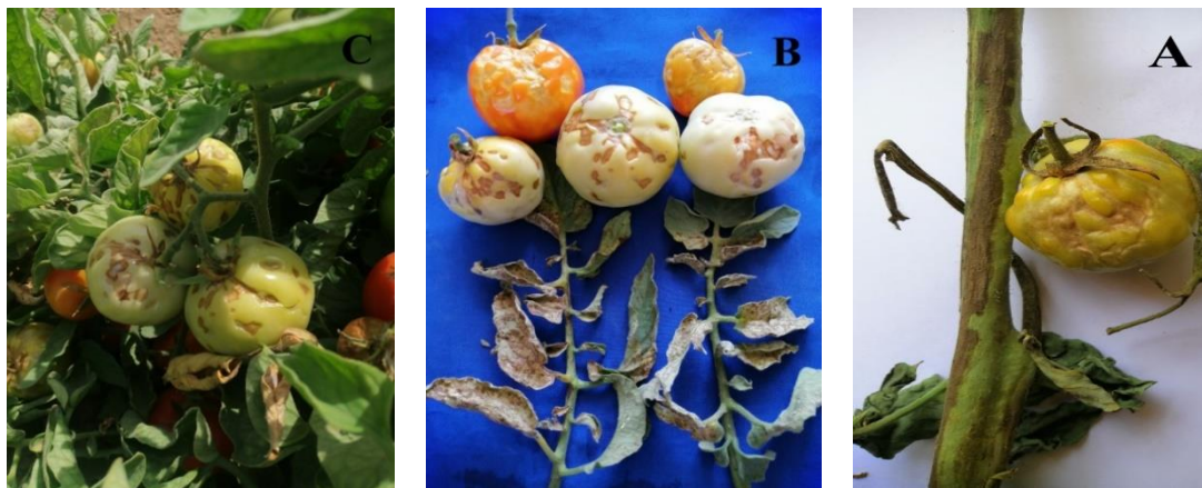
شکل ۱. علائم مشاهده شده در بوته گوجه فرنگی در یک گلخانه ای در اطراف شیراز آلوده به ویروس تورادو گوجه‌فرنگی A: بافت‌مردگی کشیده‌شده روی ساقه B: لکه‌های بافت‌مرده روی میوه و برگ. C: لکه‌های نکروز بافت‌مرده برگ و بدشکلی میوه در نمونه جمع‌آوری شده از مزارع اطراف شهرستان شیراز.